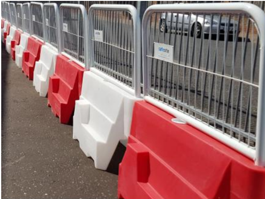
圖 3: 停機坪內圍欄樣式